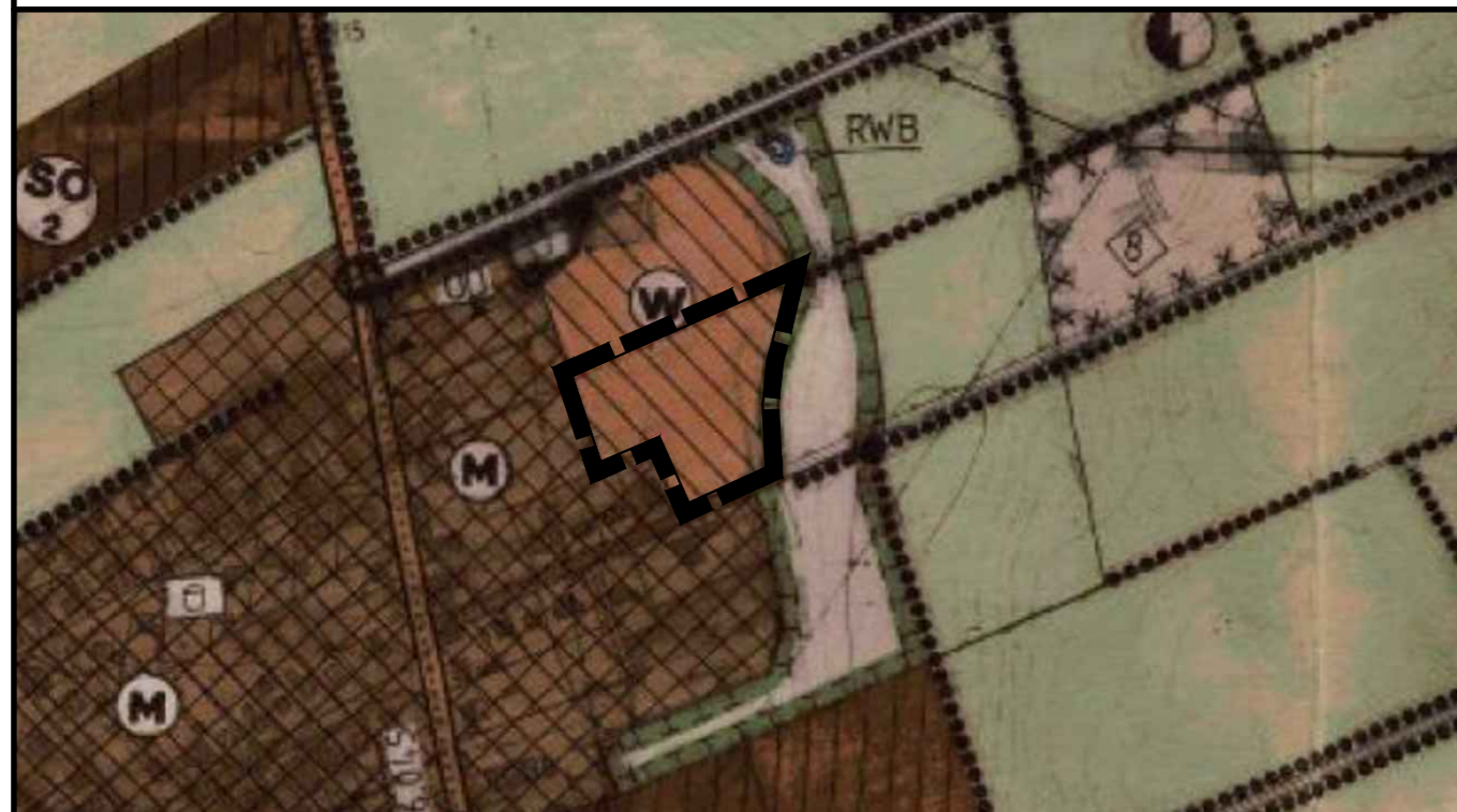
Ausschnitt aus dem Flächennutzungsplan